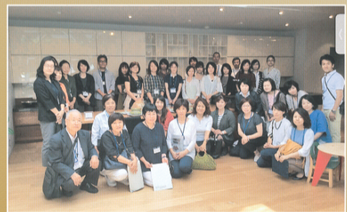
インテリア見学会の様子(栃木IC協会)